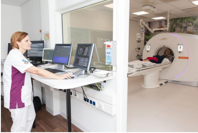
Afbeelding 3: De laborant ziet u door een raam

Tijdens het onderzoek is de laborant in de ruimte naast de CT-kamer aanwezig. De laborant kan u zien door een raam en met u praten via een intercom.