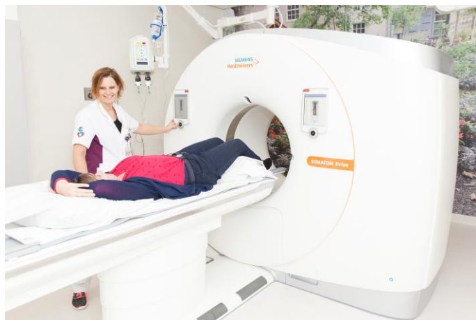
Afbeelding 2: De CT-scan

Voor het onderzoek vraagt de röntgenlaborant u uw kleding uit te trekken en een schortje aan te doen.