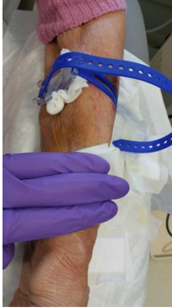
Afbeelding 2: U drukt zelf één prikgaatje dicht en het andere prikgaatje wordt met een afdrukbandje dicht gedrukt.