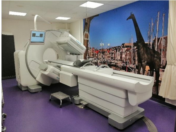
Afbeelding 2: De gammacamera.

Een uur na de injectie worden er foto's gemaakt met een gammacamera. Dit is een speciale camera die radioactieve vloeistof kan fotograferen. Hierdoor wordt de klier (of klieren) zichtbaar op de foto's.