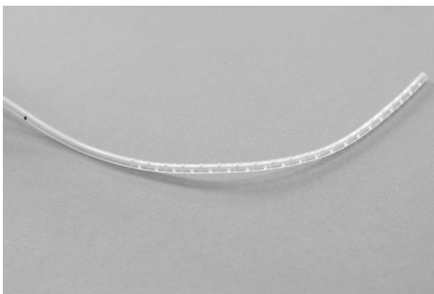
Afb. 1: Er zitten kleine gaatjes in de drain

Een drain is een dun slangetje van plastic. Een deel daarvan heeft kleine gaatjes (zie afb. 1). Via de kleine gaatjes wordt bloed en wondvocht uit het operatiegebied afgevoerd.