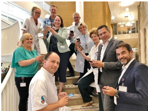
Start BeterDichtbij, een belangrijke E-health tool voor de communicatie tussen arts en patiënt.

Op verzoek van de Inspectie Gezondheidszorg (Governance Code) en het Auditteam van NIAZ/ Qmentum (Certificering) vonden er gesprekken plaats met een delegatie vanuit de Cliëntenraad.