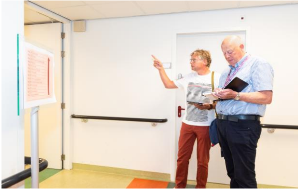
Monitorronde gelopen door de Cliëntenraad

Een lid van de Raad nam deel aan het 'Quality & Safety Congres', dat dit jaar in Glasgow werd gehouden. Enkele andere leden waren betrokken bij gesprekken rond de Governance Code.