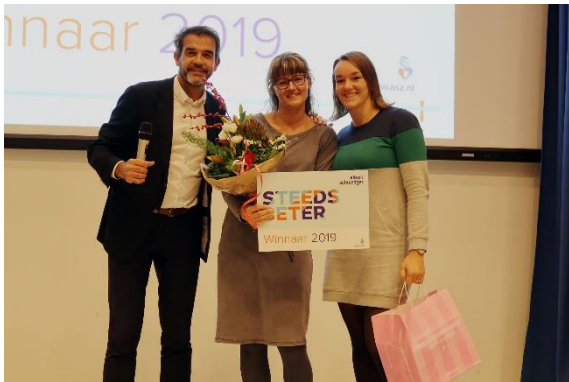
Uitreiking Steeds Beter prijs aan de IC afdeling

Door de Cliëntenraad zijn ook contacten onderhouden met vertegenwoordigers van CRaden van andere ziekenhuizen in het kader van: mProve, Stichting Beter Keten, het e-Health Project van de Metropoolregio Rotterdam of andere (incidentele) samenwerkingsverbanden. Ook zijn bijeenkomsten van o.a. NVZ, NCZ, STZ-ziekenhuizen en CONCORD bijgewoond. Met name de nieuwe (gewijzigde) wet op de medezeggenschap, vraagt de komende tijd aandacht.