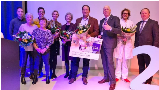
Uitreiking TopASz Award aan de afdeling Hematologie