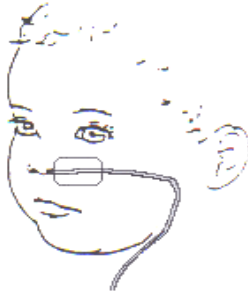
Afbeelding 2: Plakken van de sonde

De pleister wordt direct naast de neus geplakt, zodat uw kind de vingers er niet tussen kan krijgen om de sonde eruit te trekken.