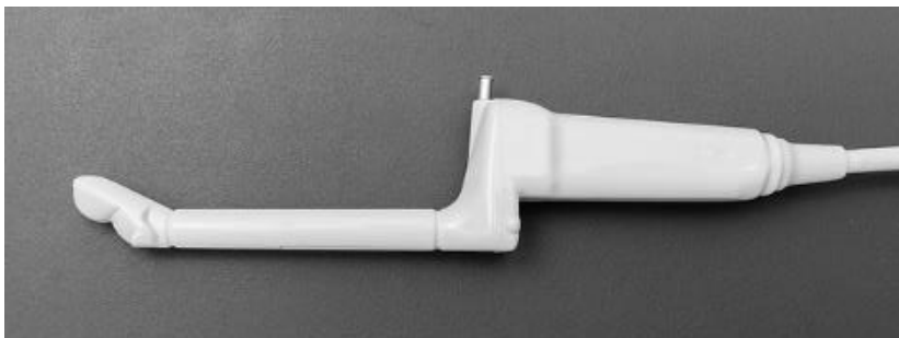
Afbeelding 2: het linkerdeel van de echosonde tot aan de eerste bocht