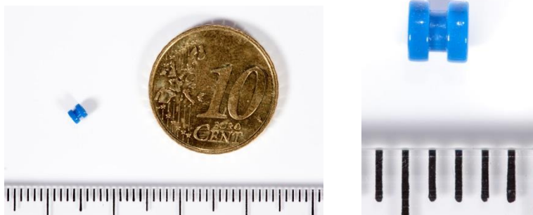
Afbeelding 3: Een trommelvliesbuisje

Er zijn verschillende typen trommelvliesbuisjes. Het trommelvliesbuisje valt er meestal na verloop van tijd vanzelf uit.