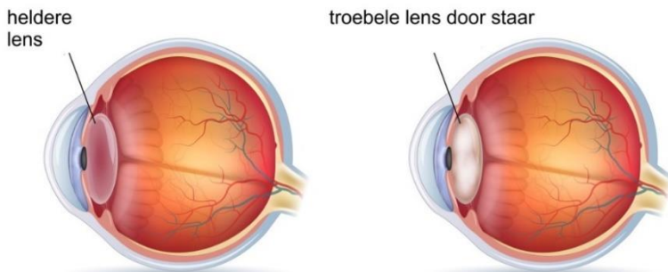
Afbeelding 1: Dwarsdoorsnede van het oog.

Staar of cataract is het troebel worden van de oog lens. Het ontwikkelt zich meestal langzaam, maar soms ook snel, in bijvoorbeeld enkele weken. De oog lens ligt achter de gekleurde iris (regenboogvlies) en is onder normale omstandigheden helder. De lens zorgt ervoor, dat de dingen die we zien, scherp op het netvlies worden afgebeeld. Als de oog lens troebel wordt (staar), wordt het beeld op het netvlies wazig, het zien wordt dus slechter.