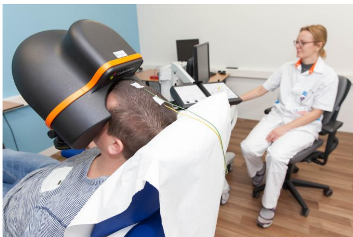
Afbeelding 3: De halfronde bol is voor uw gezicht geplaatst.

De laborant plaatst een halfronde bol voor uw gezicht (zie afbeelding 3). In deze bol krijgt u een aantal lichtflitsen te zien. De lichtflitsen veranderen steeds van kleur en sterkte. Dit duurt ongeveer 15 minuten.