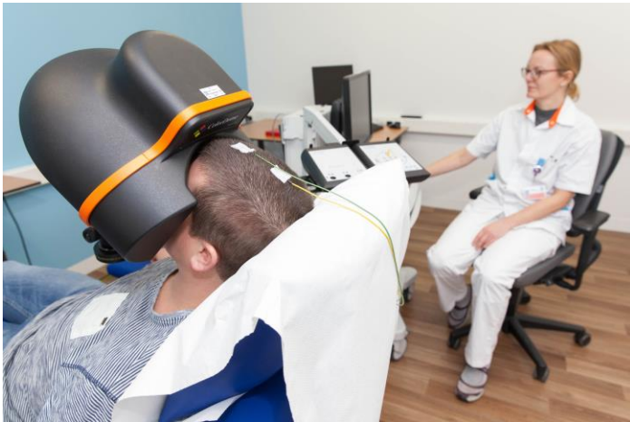
Afbeelding 3: De halfronde bol is voor uw gezicht geplaatst.

De laborant plaatst een halfronde bol voor uw gezicht (zie afbeelding 3). In deze bol krijgt u een aantal lichtflitsen te zien. De lichtflitsen veranderen steeds van kleur en sterkte. Dit duurt ongeveer 15 minuten.