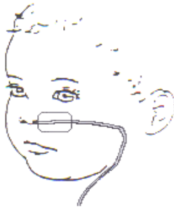
Afbeelding 2: Plakken van de sonde

De pleister wordt direct naast de neus geplakt, zodat uw kind de vingers er niet tussen kan krijgen om de sonde eruit te trekken.