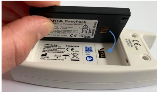
Afbeeldingen 3: Correct plaatsen van de accu.