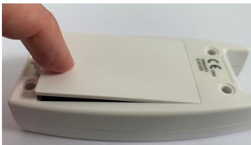
Afbeelding 4: Correct sluiten van het klepje.