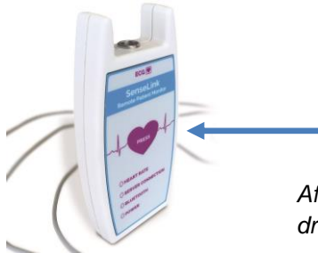
Afbeelding 7: Knop om op te drukken bij klachten.