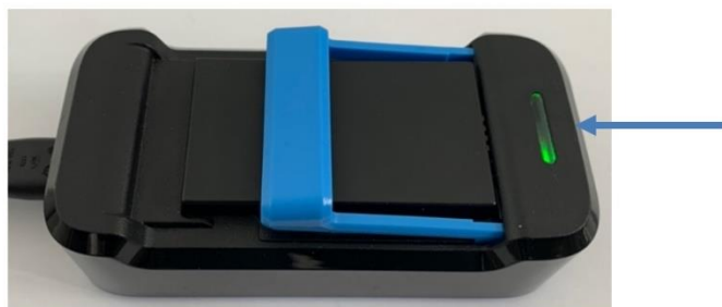
Afbeelding 6: Volledig opgeladen accu.

Zodra het lampje van de oplader continu groen brandt is de accu volledig opgeladen (zie afbeelding 6).