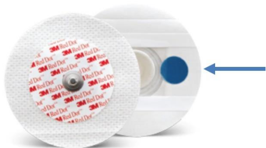
Afbeelding 2: Plakker en het ronde schuurvlakje.