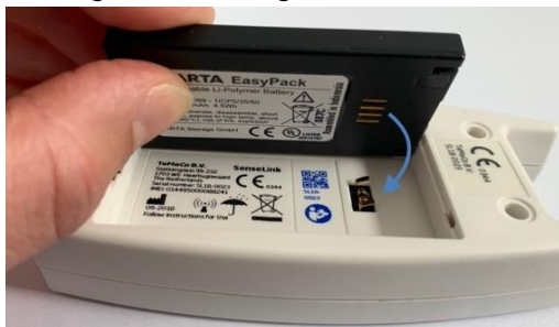
Afbeeldingen 3: Correct plaatsen van de accu.

Let op: als u voelt dat het klepje niet goed dicht gaat? Controleer dan of u de accu er goed in heeft gedaan.