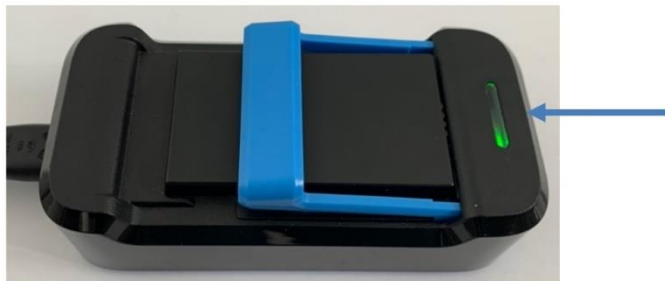
Afbeelding 6: Volledig opgeladen accu.

Zodra het lampje van de oplader continu groen brandt is de accu volledig opgeladen (zie afbeelding 6).