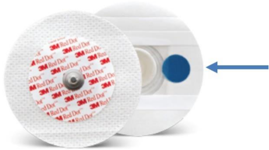
Afbeelding 2: Plakker en het ronde schuurvlakje.

Kijk goed of het Heart rate lampje nog steeds groen knippert als u iets heeft hersteld.