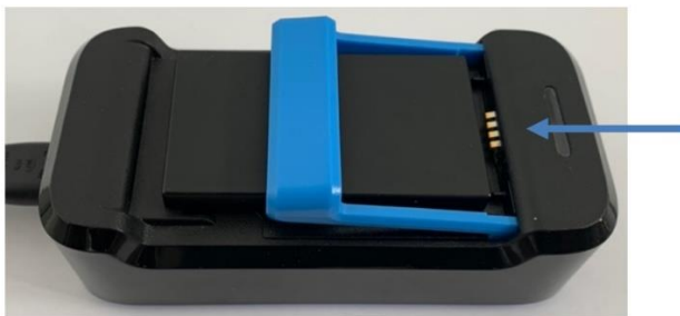
Afbeelding 5: Onjuist geplaatste accu.

Bij de holster die u krijgt wordt een extra accu en een oplader meegeleverd. Het is belangrijk dat u de lege accu uit de holster oplaadt. Zorg ervoor dat de accu goed in de oplader klikt. op afbeelding 5 op de volgende pagina ziet u dat de accu niet goed zit en dus ook niet wordt opgeladen.