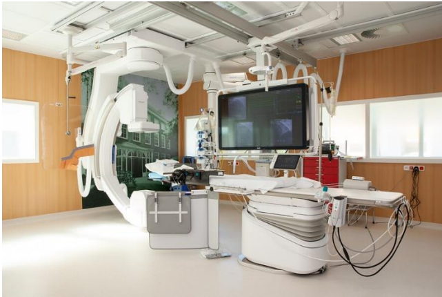
Afbeelding 2: De behandelkamer

De implantatie gebeurt op de behandelkamer die naast de Dagbehandeling G1 zit.