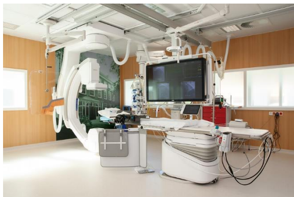
Afbeelding 4: De behandelkamer.

De implantatie vindt plaats op de behandelkamer die naast Dagbehandeling G1 ligt. (zie afbeelding 4).