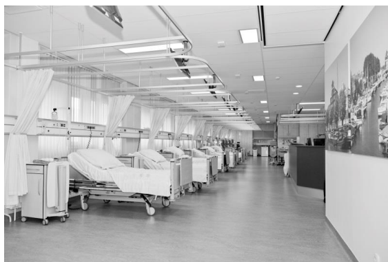
Afbeelding 3: Dagbehandeling G1.

De tijd die met u is afgesproken is de tijd van uw opname en niet de tijd van uw behandeling. Dit is namelijk afhankelijk van de behandelduur van de patiënten die voor u aan de beurt zijn.