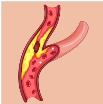
De vernauwing in de halsslagader.