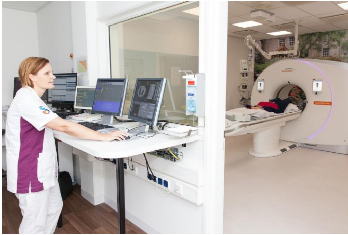
Afbeelding 3: De laborant ziet u door een raam

Tijdens het onderzoek is de laborant in de ruimte naast de CT-kamer aanwezig. De laborant kan u zien door een raam en met u praten via een intercom.