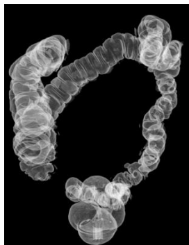
Afbeelding 1: Een CT-scan van de dikke darm

Bij het onderzoek worden dwarsdoorsnede-foto's van uw dikke darm gemaakt. Hiermee krijgen we driedimensionale informatie over de vorm, de ligging en de structuur van uw darmen. Zo is het mogelijk om van buitenaf beelden te krijgen van het binnenste van uw dikke darm. De beelden lijken op de beelden van een coloscopie, een inwendig onderzoek van de dikke darm. De CT-colonografie wordt ook wel 'virtuele coloscopie' genoemd.