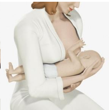
Afb.5 doorgeschoven houding