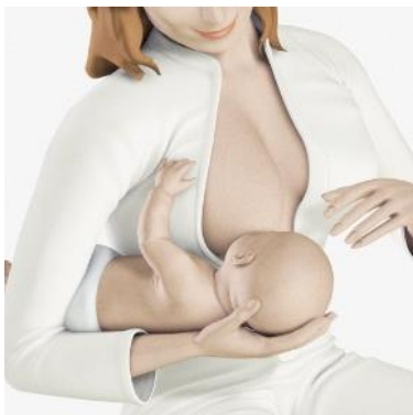
Afb.4 : Rugbyhouding