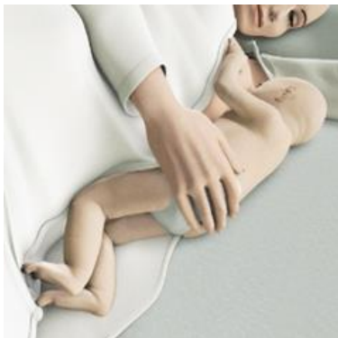
Afb.2 Liggend op de zij