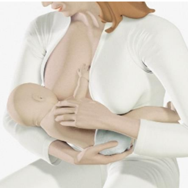
Afb.3 Madonna houding