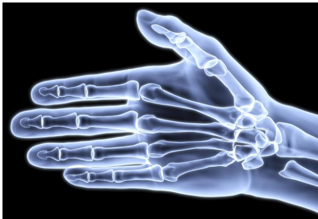
Afbeelding 1: Röntgenfoto van een gezonde rechterpols.

In een gezond gewricht zijn de uiteinden van de botten bedekt met een laagje kraakbeen, zodat de pols soepel kan bewegen. Als het kraakbeen van een pols ernstig beschadigd is of versleten, is vervanging van het polsgewricht (kunstgewricht) of vastzetten van de pols soms een oplossing.