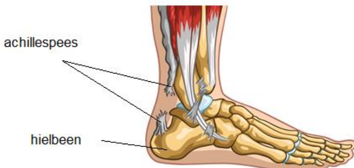
Afbeelding 1: De achillespees is gescheurd

De achillespees bevestigt de kuitspieren aan het hielbeen. Het is een belangrijke pees, waar vaak grote krachten op komen. Zo is bijvoorbeeld het trekken van een sprintje een hoge belasting voor de achillespees.