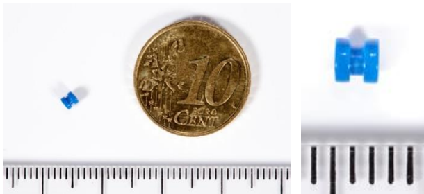
Afbeelding 3: Een trommelvliesbuisje

Er zijn verschillende typen trommelvliesbuisjes. De meest gebruikte blijft gemiddeld iets meer dan een jaar in het trommelvlies. Daarna groeit het vanzelf eruit.