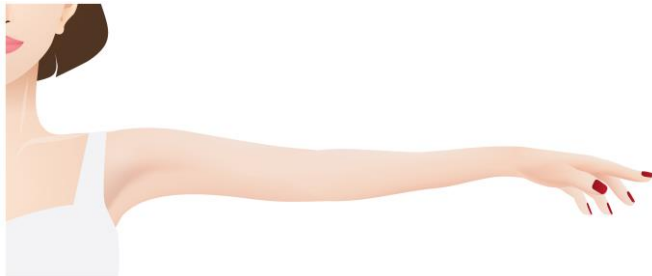
Afbeelding 3: U mag uw arm niet hoger optillen dan zo