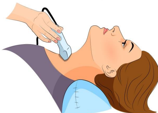
Echografie van de schildklier*

De echosensor zendt geluidsgolven uit die worden teruggekaatst door organen en weefsels. De sensor vangt deze geluidsgolven op en stuurt ze naar de computer, die er een beeld van maakt. Dit onderzoek is niet pijnlijk.