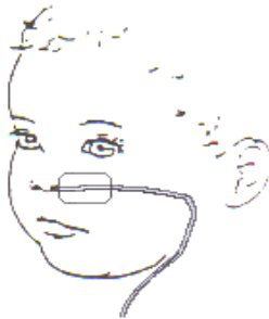
Afbeelding 2: Plakken van de sonde

De pleister wordt direct naast de neus geplakt, zodat uw kind de vingers er niet tussen kan krijgen om de sonde eruit te trekken.