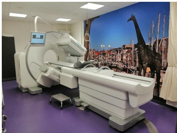
Afbeelding 2: De gammacamera.

Een uur na de injectie worden er foto's gemaakt met een gammacamera. Dit is een speciale camera die radioactieve vloeistof kan fotograferen. Hierdoor wordt de klier (of klieren) zichtbaar op de foto's.