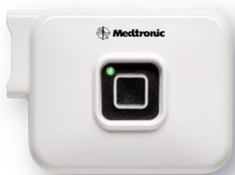
Afbeelding 4: De uitwendige stimulator is ongeveer 3 bij 4 cm.

De tijdelijke geleidingsdraad wordt vervolgens via een kabeltje op de uitwendige stimulator aangesloten (zie afbeelding 4). U draagt de uitwendige stimulator aan een riempje om uw lichaam.