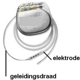
Afbeelding 2: De elektrode geeft stroomstootjes af aan de zenuwen.