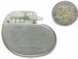
Afbeelding 1: De neurostimulator is ongeveer twee keer zo groot als een 2 euro munt.