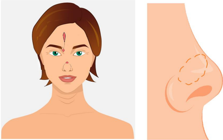
Afbeelding 2: Voorhoofdslap twee en/of derde operatie