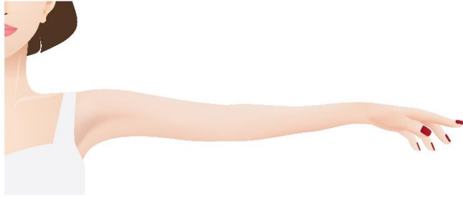
Afbeelding 3: U mag uw arm niet hoger optillen dan zo