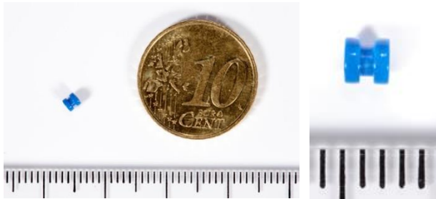
Afbeelding 3: Een trommelvliesbuisje

Er zijn verschillende typen trommelvliesbuisjes. De meest gebruikte blijft gemiddeld iets meer dan een jaar in het trommelvlies zitten. Daarna groeit het buisje er vanzelf uit.