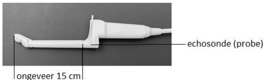
Afb. 2: Het linkerdeel van de echosonde (tussen de twee lijnen) wordt in uw anus ingebracht.

De uroloog voelt soms eerst met zijn vinger uw prostaat (via uw anus). Daarna brengt hij de echosonde (ook wel probe genoemd) in om de prostaat op te meten (zie afb. 2).