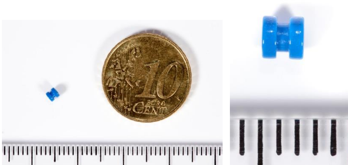
Afbeelding 3: De grootte van een een trommelvliesbuisje.

Er zijn verschillende typen trommelvliesbuisjes. De meest gebruikte blijft gemiddeld iets meer dan een jaar in het trommelvlies. Daarna groeit het vanzelf eruit.